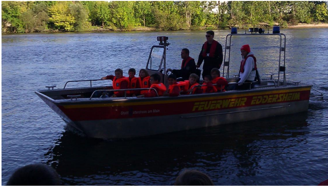
Bootsfahren auf dem Main