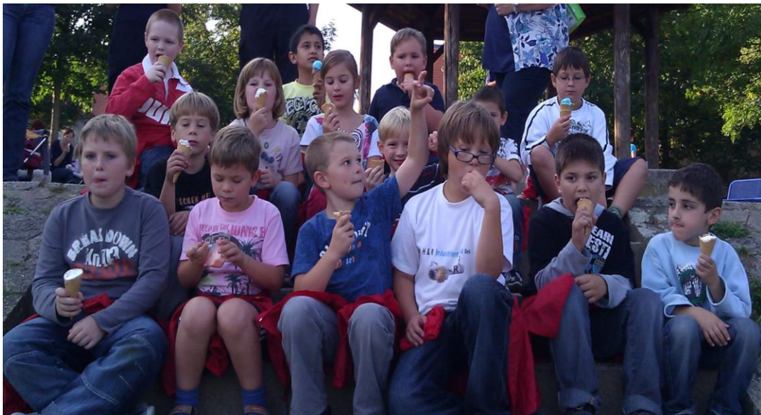
Eisessen am Mainufer