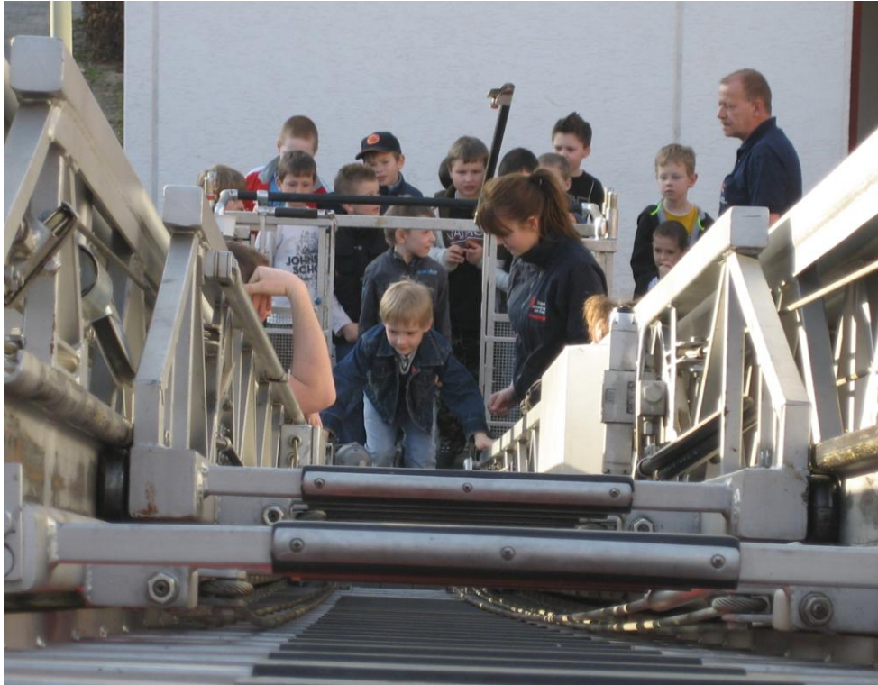
Die Drehleiter zu Besuch in Eddersheim